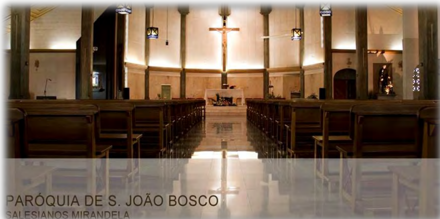
PARÓQUIA DE S. JOÃO BOSCO SALESIANOS MIRANDELA